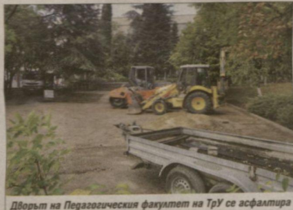
Дворът на Педагогическия факултет на ТрУ се асфалтира

- През тази година се проведе институционалната акредитация на Тракийския университет. Само преди месец Националната агенция по оценяване и акредитация прие доклада на комисията. Нашата оценка е