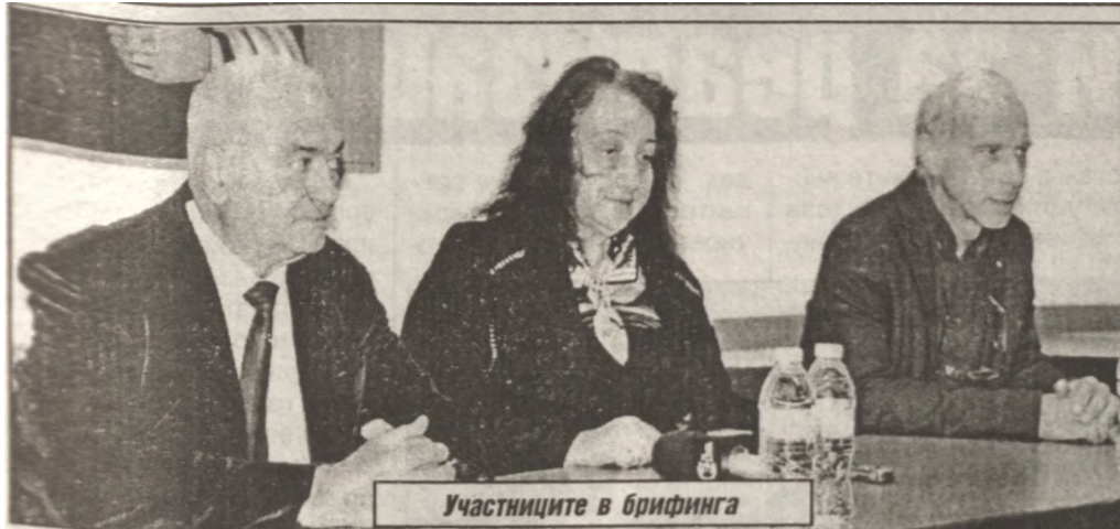
Участниците в брифинга