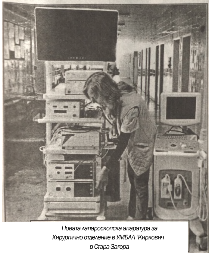
Новата лапароскопска апаратура за Хирургично отделение в УМБАЛ "Киркович" в Стара Загора

Нова лечебно-диагностична апаратура е доставена за нуждите на УМБАЛ "Проф. д-р Стоян Киркович" в Стара Загора. Тя е на обща стойност 500 хил. лева и с нея ще се извършват лапароскопс-